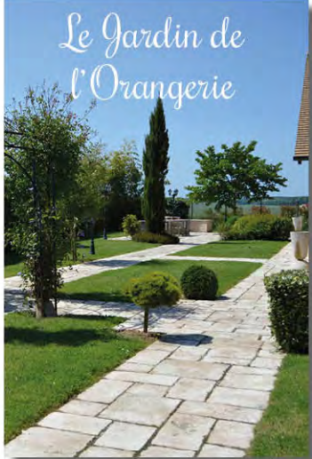
Le Jardin de l'Orangerie